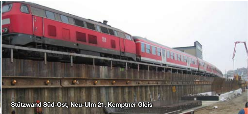
Stützwand Süd-Ost, Neu-Ulm 21, Kemptner Gleis