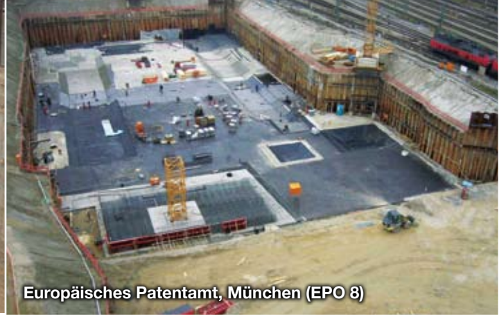
Europäisches Patentamt, München (EPO 8)