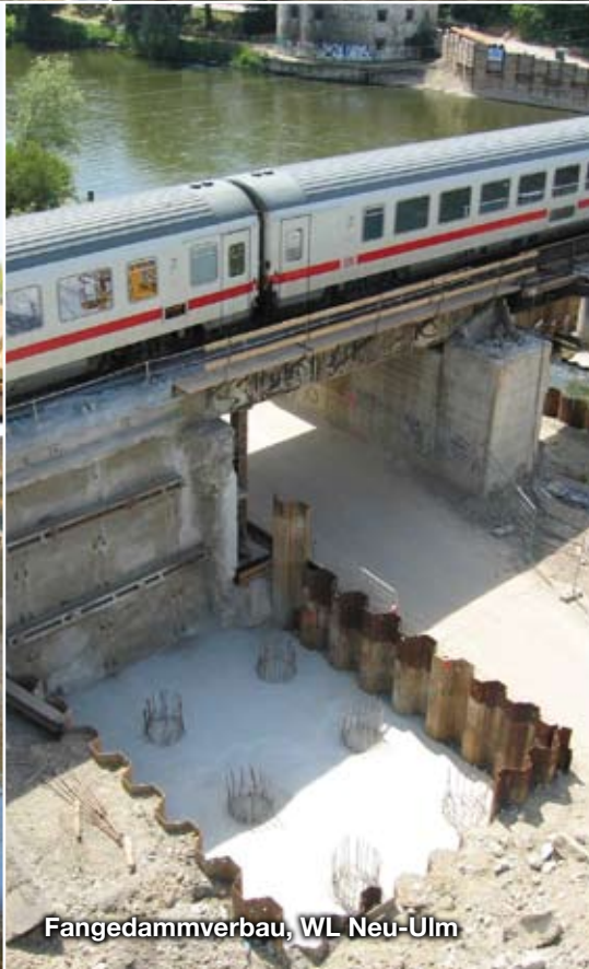
Fangedammverbau, WL Neu-Ulm