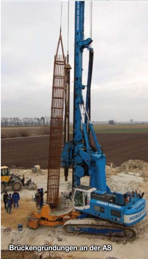
Brückengründungen an der A8