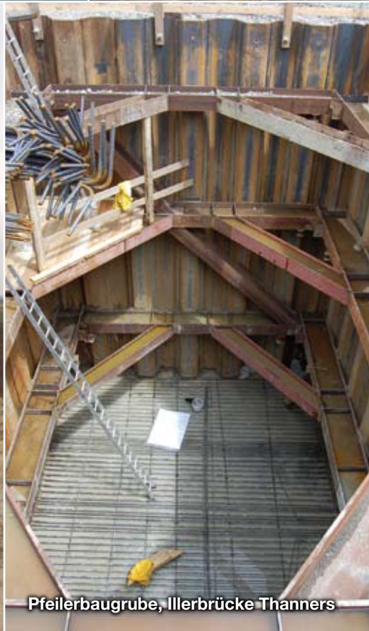
Pfeilerbaugrube, Illerbrücke Thanners