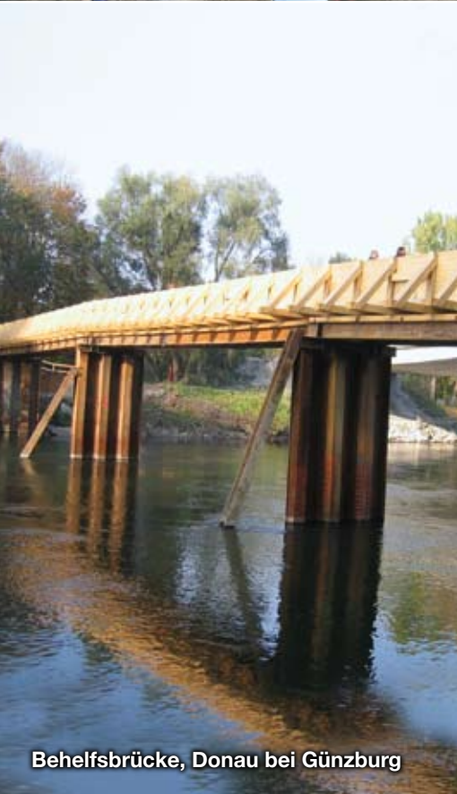
Behelfsbrücke, Donau bei Günzburg