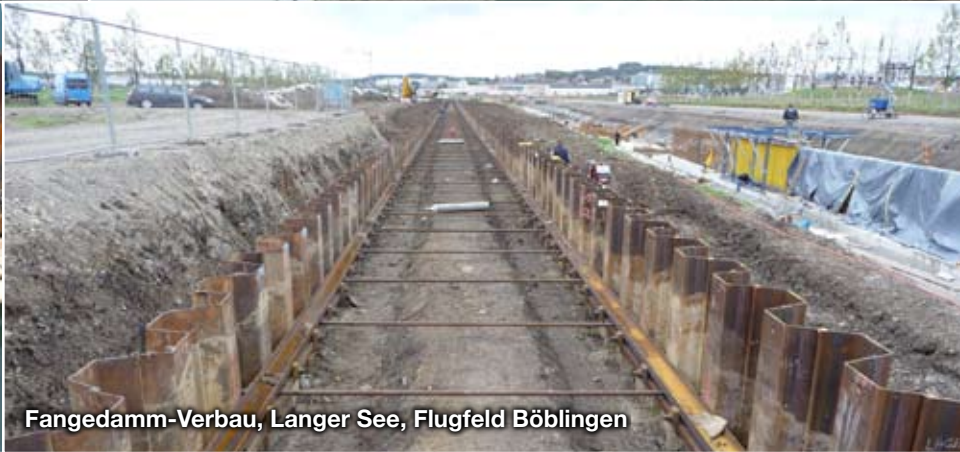
Fangedamm-Verbau, Langer See, Flugfeld Böblingen