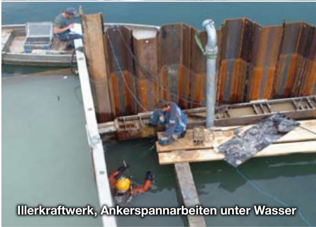
Illerkraftwerk, Ankerspannarbeiten unter Wasser