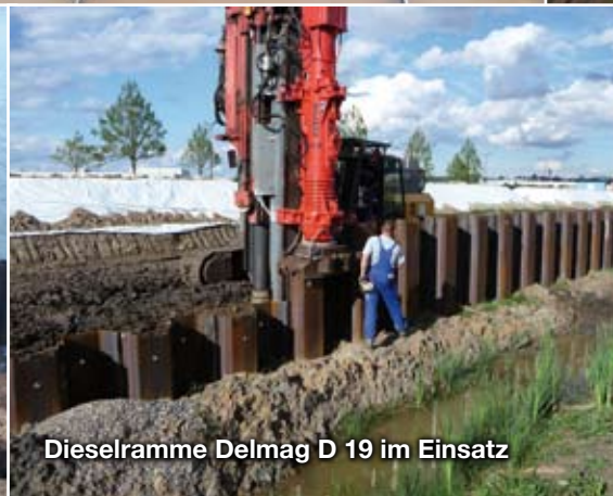
Dieselramme Delmag D 19 im Einsatz