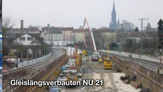
Gleislängsverbauten NU 21