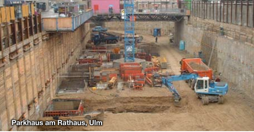
Parkhaus am Rathaus, Ulm