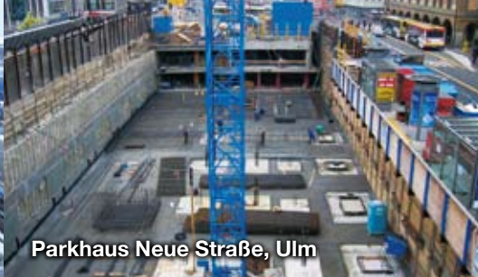
Parkhaus Neue Straße, Ulm