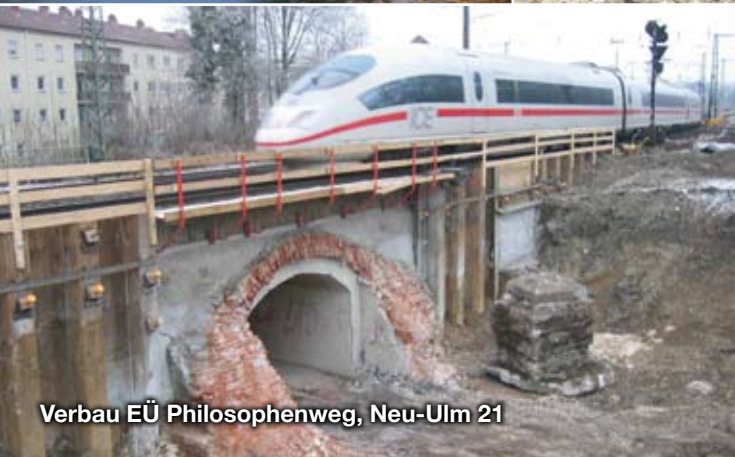
Verbau EÜ Philosophenweg, Neu-Ulm 21