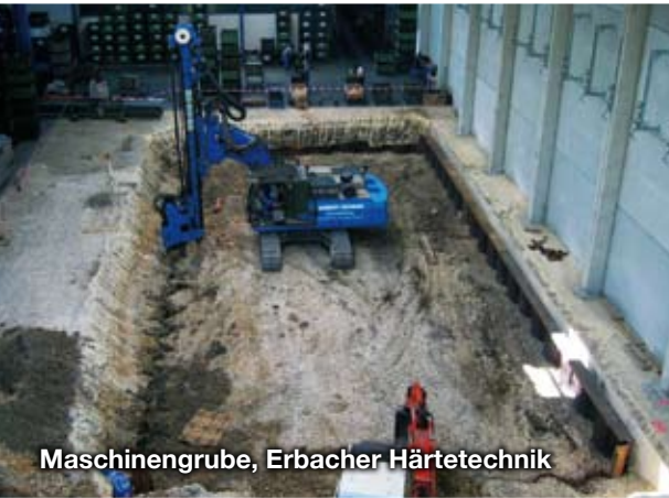
Maschinengrube, Erbacher Härtetechnik