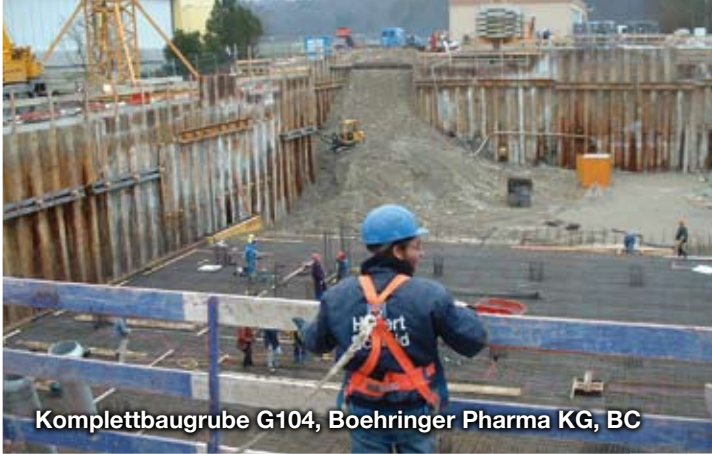
Komplettbaugrube G104, Boehringer Pharma KG, BC